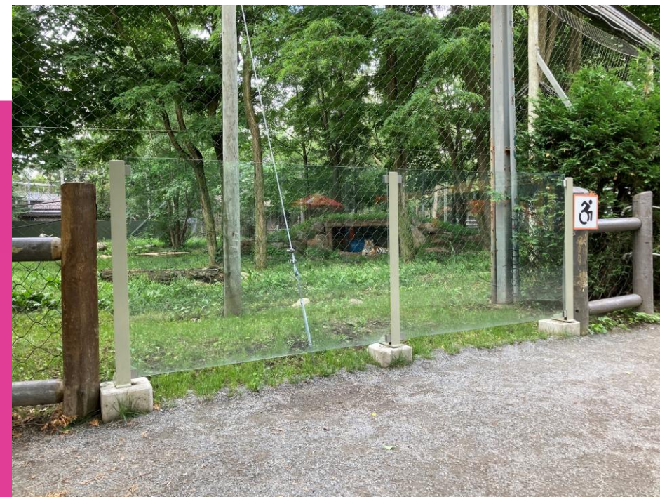
Figure 4 : Point de vue de l'enclos des tigres