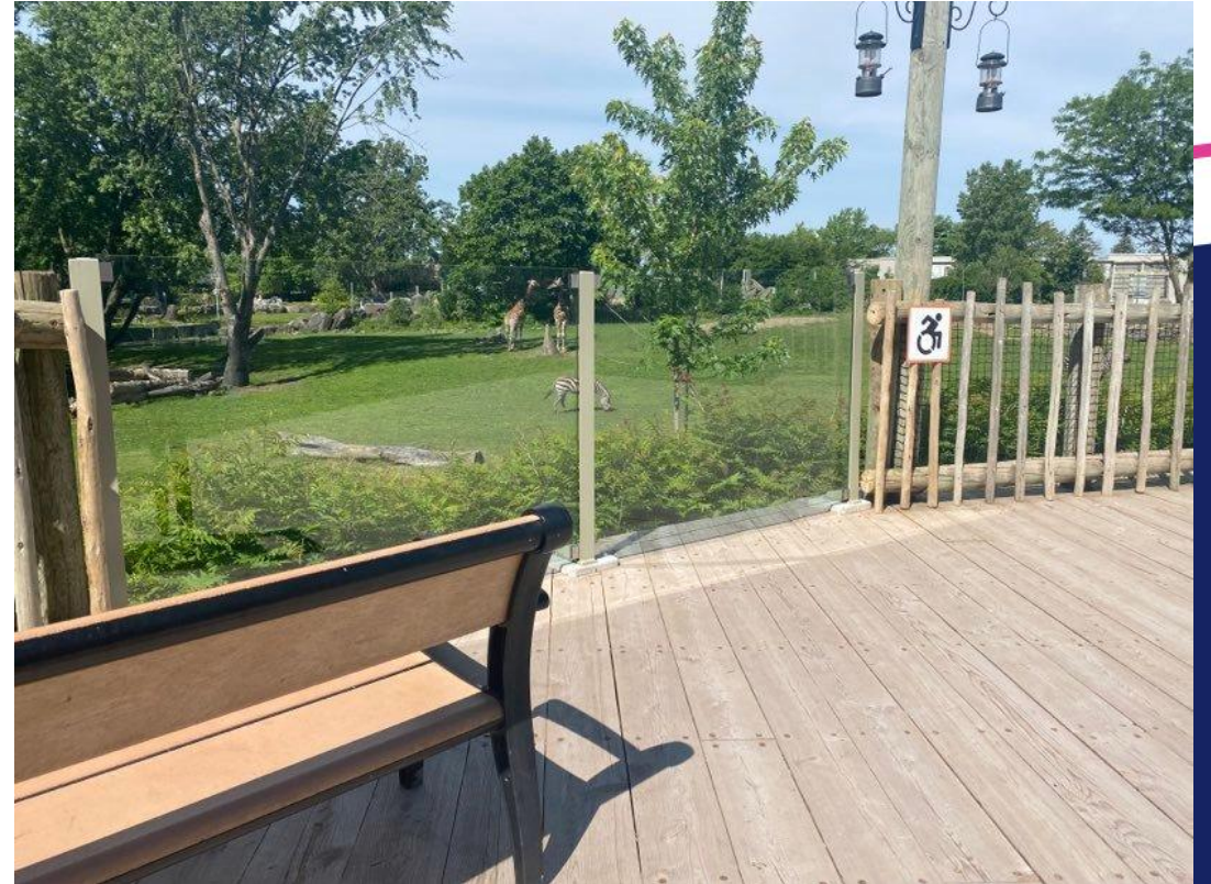
Figure 3 : Point du vue savane africaine