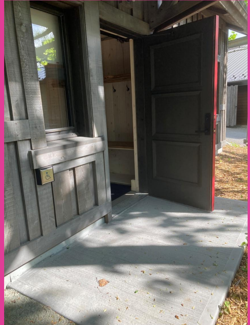
Figure 2 : Entrée du chalet le Yack